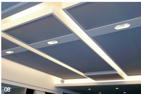
08. 錄音室的天花板有特別設計過，除了嵌入燈光之外，也配置了軟質材料減少初次反射音。