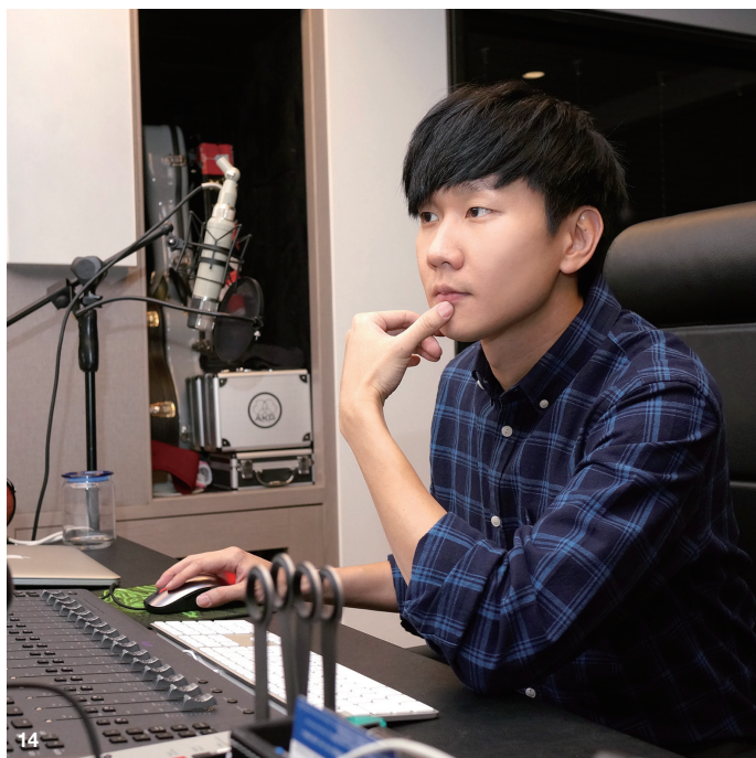
14. 林俊傑一直以來對於錄音品質相當要求，過去也請Bernie Grundman為專輯進行母帶處理。