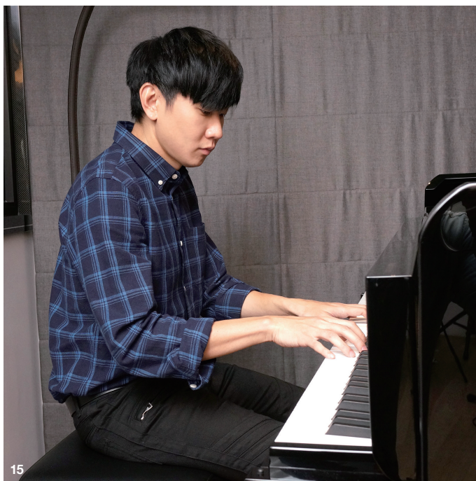
15. 鋼琴是最常出現在林俊傑音樂裡的樂器，也透過鋼琴創作出不少膾炙人口的抒情歌曲。