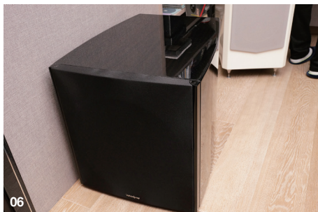
06. 主動式超低音是Velodyne Digital Drive Plus 12。