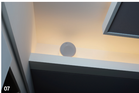
07. 從天花板後方觀察，可以看到環繞喇叭為Focal Dome，顏色則統一選擇白色。